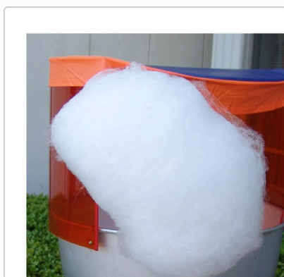
ふんわり大きな綿菓子の完成

綿が出始めたら、割り箸で巻き取っていきます。 割り箸を回しやすい方向に回転させながら、釜の周りを大きくかき回して巻き取ってください。 箸を皿に沿って大きく回さず一箇所で回しても綿菓子はできますが、皿に沿って大きく回した方が本当にふんわりとしておいしく仕上がります。