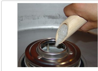
ザラメは釜の中心へ

電源コードを直接コンセントに差し込み、電源スイッチを「ON」にします。 ヒーターコントロールを「7」に合わせ、アンペアメーターの針が「10～11」の間になっているか確認してください。なっていない場合はヒーターコントロールを微調整します。 そのまま1～2分ほど空転させて予熱します。