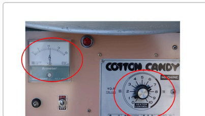
アンペアメーター（左）と ヒーターコントロール（右）